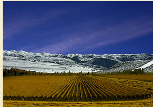
Vingård i Mendoza (provins)